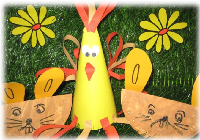
Zdjęcie prezentuje prace dzieci z Przedszkola w Nędzy

Babice * Ciechowice * Górkki Śląskie * Łęg * Nędza * Szymocice * Zawada Książęca