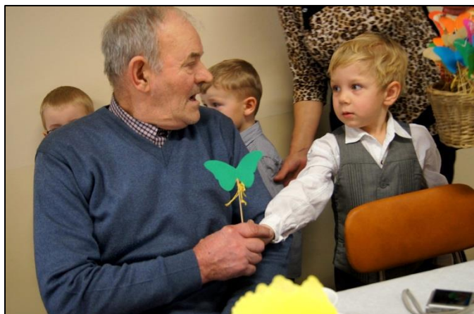
• Dzieci wręczyły babciom i dziadkom własnoręcznie zrobione papierowe ozdóbki. Były całusy i uściski.

młodzianka skrzypaczka, a po niej kwintet muzyczny składający się z młodych instrumentalistów, którzy przyjechali na święto do Zawady Ks. aż spod Góry św. Anny. Doskonale trafili w gusta seniorów, bawili świetnym repertuarem, energią i dowcipem.