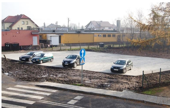
• Nowy parking może pomieścić co najmniej kilkanaście samochodów

N a miejsca parkingowe został przeznaczony fragment działki, którą Gmina kupiła w ubiegłym roku za 100 tys. zł. Kolejną część (mniej więcej 1/3 powierzchni całej działki) Gmina w tym roku za ponad 73 tys. zł brutto sprzedała w drodze przetargu prywatnemu inwestorowi - Przedsiębiorstwu Wielobranżowemu "Maximus" z Kuźni Raciborskiej. I właśnie tę kwotę Gmina przeznaczyła na budowę parkingu przy ul. Jana III Sobieskiego.