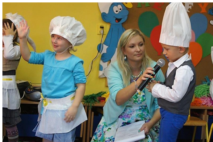
• Grupa mianowanych Smerfów liczy 20 dzieci w wieku 2,5 - 3 lat

Pani Izabela , mama małej Ani , chwali też pomysł prowadzenia przez placówkę swojego profilu na