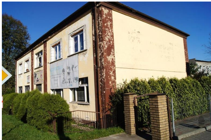
• W jednym z budynków działa rodzinkowy dom dziecka (na zdjęciu), w drugim mieści się Dom Nauczyciela

• Zmodernizowane mają zostać dwa obiekty przy ul. Leśnej znajdujące się w bezpośrednim sąsiedztwie szkoły w Nędzy. Projekt zakłada m.in. nową ekologiczną kotłownię, solary, ocieplenie ścian i nowe okna. Gmina złożyła wniosek o wsparcie inwestycji do WFOŚiGW w Katowicach.