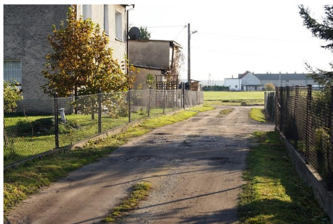
• Ul. Kosmonautów w Ciechowicach jeszcze przed remontem

Ul. Księżycowa remontowana jest od skrzyżowania z drogą wojewódzką, ul. Powstańców Śląskich do skrzyżowania z ul. Dojazdową. Łączna jej długość to 237 metrów. Ułożona zostanie nawierzchnia na