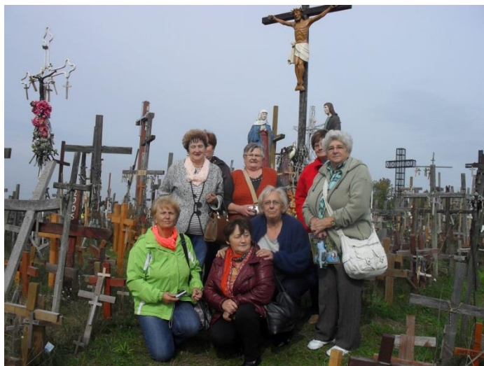
• Podczas wyprawy stowarzyszenie odwiedziło m.in. Sokółkę, a po drodze Świętą Górę

W organizowanych przez stowarzyszenie z Nędzy wyprawach biorą udział nie tylko jego członkowie. - Z naszych propozycji korzystają też pozostali mieszkańcy,